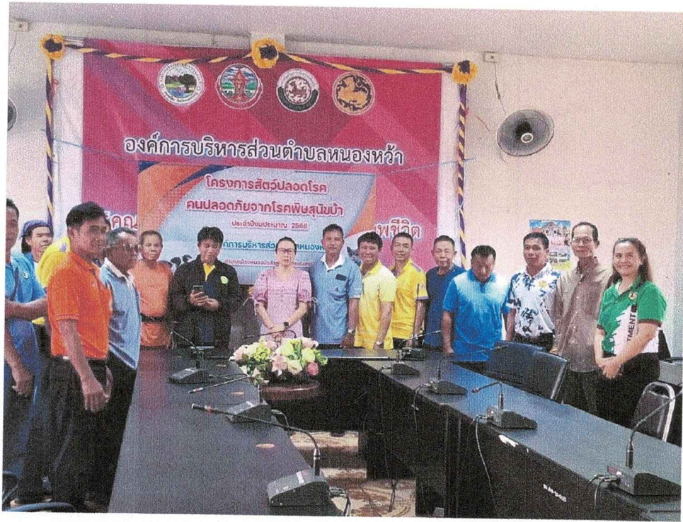
อบรมอาสาปศุสัตว์ตำบลหนองหว้า ในวันที่ ๒๖ มีนาคม ๒๕๖๘ ณ ห้องประชุมองค์การบริหารส่วนตำบลหนองหว้า อำเภอเมืองหนองบัวลำภู จังหวัดหนองบัวลำภู