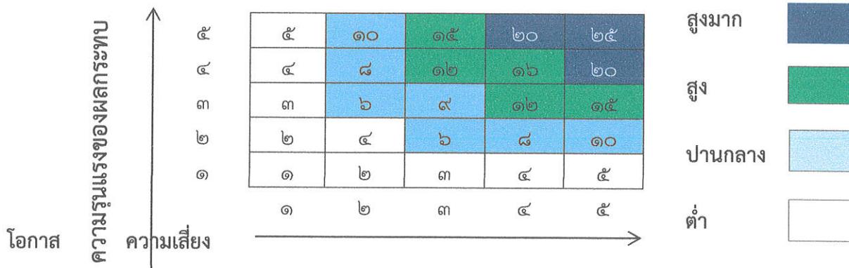
แผนภูมิความเสี่ยง (Risk Profile)

๔) ระดับความเสี่ยงสูงมาก (Extreme) คะแนนระดับความเสี่ยง ๑๗ - ๒๕ คะแนน ต้อง มีแผนลดความเสี่ยงและประเมินซ้ำ หรืออาจต้องถ่ายโอนความเสี่ยง