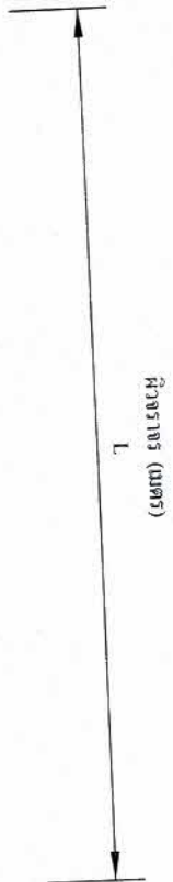
คู่มือการปฏิบัติงาน ส่วนที่ ๖ การก่อสร้าง ลักษณะการเสริมผิวจราจร ในส่วนที่ชำรุดเสียหาย พร้อมกรกลกเลียนทับ พื้นทางเดิม ปรับการเอียง